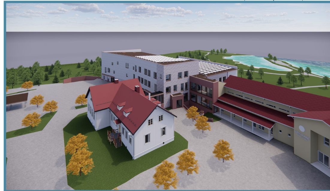
Havainnekuva koulukokonaisuuden rakennuksista. Kuva: Arkkitehdit von Boehm Oy.

Piha-alueita uudistetaan myös. Nykyinen koulun hiekkakenttä päivitetään palvelemaan paremmin eri urheilulajeja ja pihalle tulee enemmän erilaisia leikkivälineitä ja oleskeluun tarkoitettua tilaa. Piha-alueet ovat myös oppimisympäristöjä.