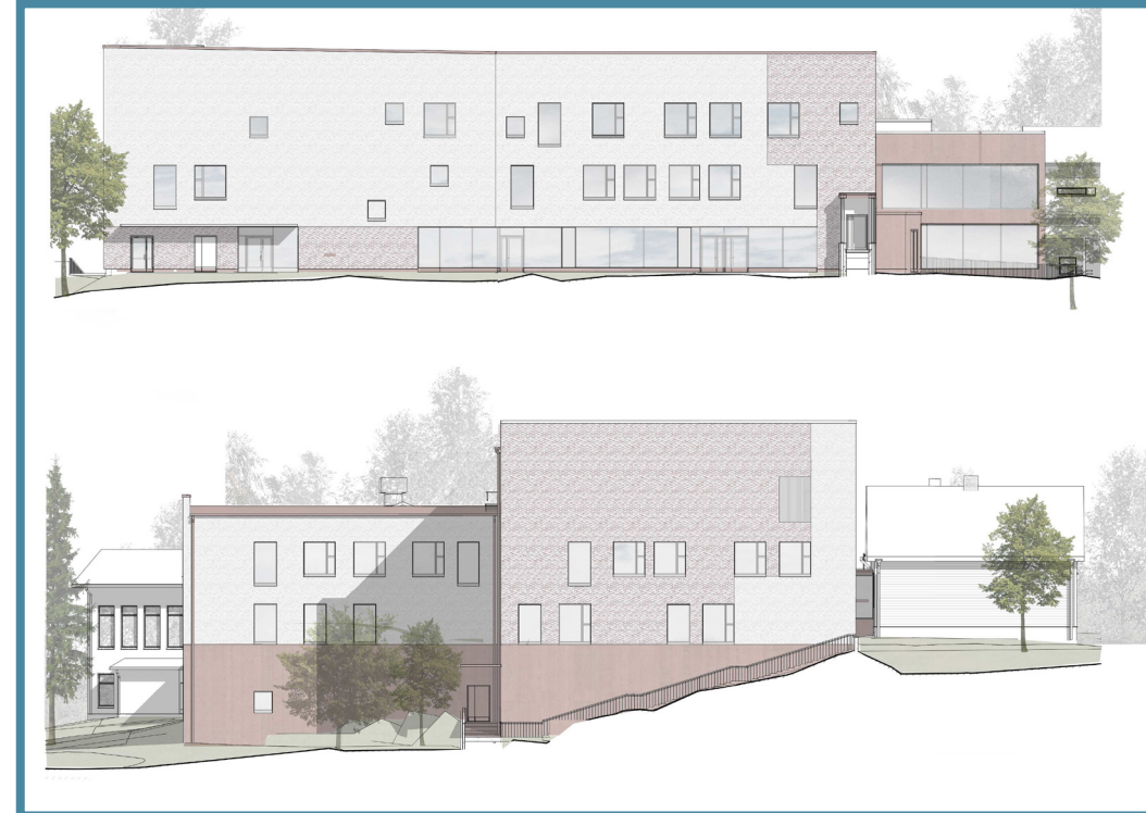
Uudisrakennuksen julkisivut itään ja etelään. Kuva: Arkkitehdit von Boehm Oy

Teoksen tulee olla valmis vuoden 2024 loppuun mennessä, mikäli se sijoittuu koulun sisätiloihin. Piha-alueet viimeistellään vuonna 2025, joten ulkotilan teos voidaan asentaa paikalle arviolta kesällä 2025.