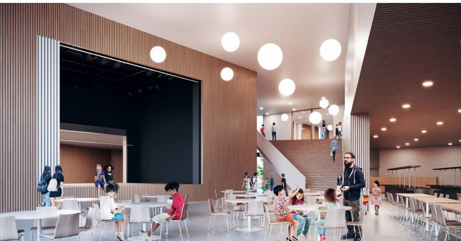
Havainnekuva sydänaulasta, Verstas Arkkitehdit Oy. Portaiden vierestä aulan kautta kulku puistoon.

Teoksen toteutuskustannuksiin on varattu enintään 70 000 € (alv 0%). Summa sisältää taiteilijapalkkion, teosmateriaalit, toteutuksen, kiinnityksen ja mahdolliset perustukset, kuljetuksen sekä asennuksen. Lisäksi tilaajalle muodostuu tekijänoikeuksiin liittyvä oikeus laatia ja julkaista dokumentaatiota teoksesta omassa viestinnässään. Kutsukilpailun taiteilijapalkkiot maksetaan laskulla.