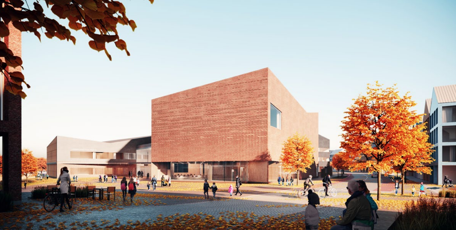
Havainnekuva, Verstaas Arkkitehdit Oy. Julkisivu torialueelle.